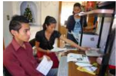
Informe de Actividades enero-febrero del 2010