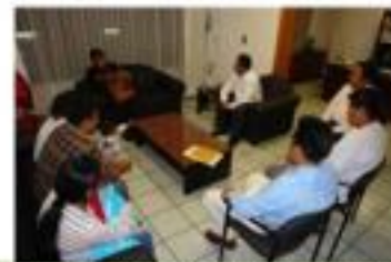
Informe de Actividades Marzo-Abril del 2009