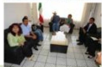
Informe de Actividades Marzo-Abril del 2009