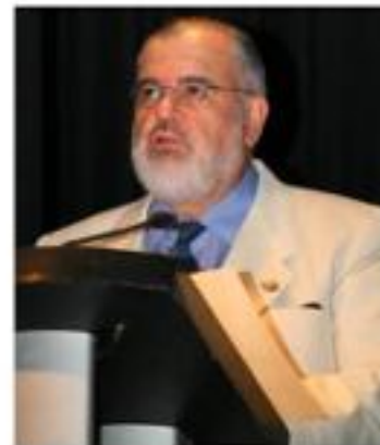
Informe de Actividades Marzo-Abril del 2009