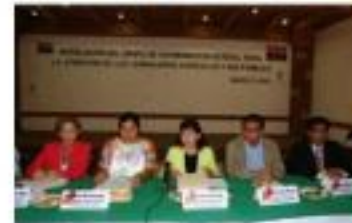
Informe de Actividades Marzo-Abril del 2009