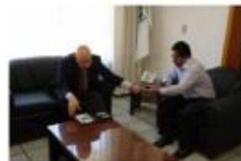
Informe de Actividades Marzo-Abril del 2009