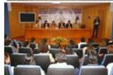
Informe de Actividades Marzo-Abril del 2009