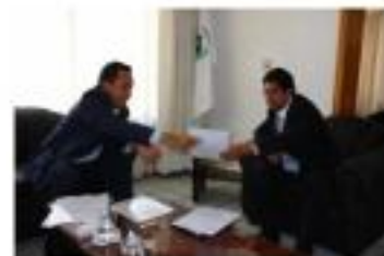
Informe de Actividades Marzo-Abril del 2009