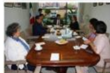
Informe de Actividades Marzo-Abril del 2009